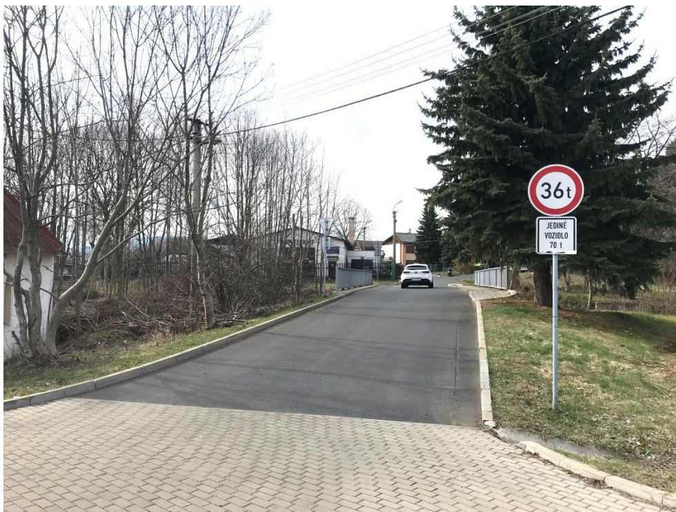
Obr.2 – Pohled v ose od Ostrova