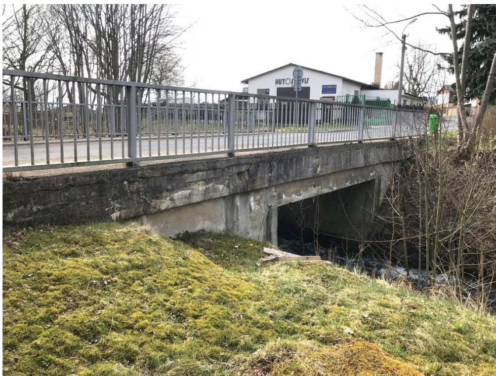
Obr.4 – Návodní strana