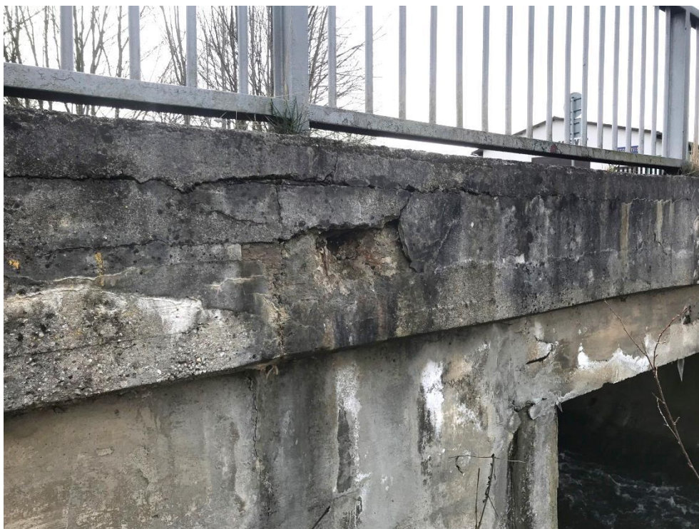
Obr.6 – Rozpad betonu římsy na návodní straně