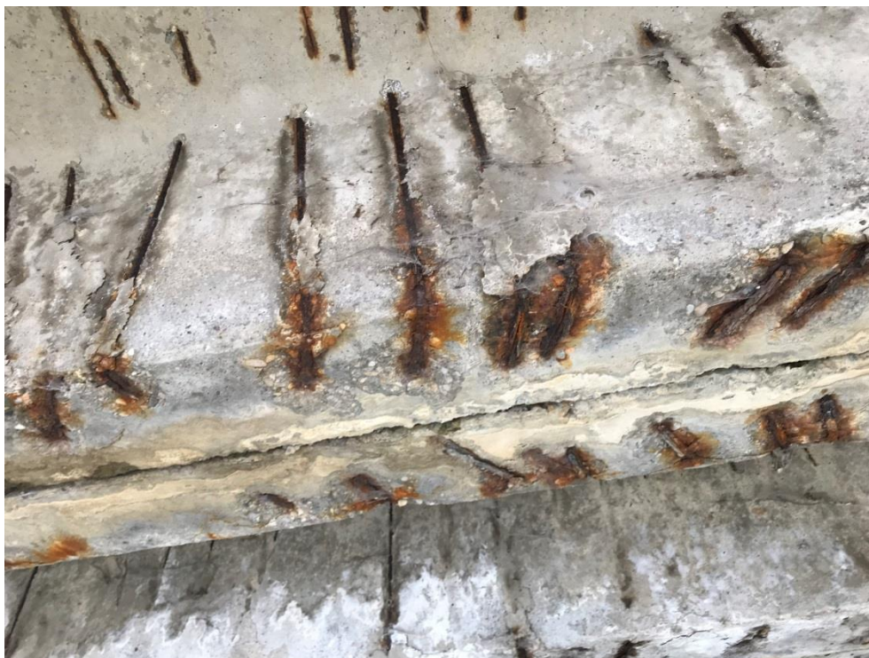
Obr.7 – Koroze třmínků výztuže prefabrikátů