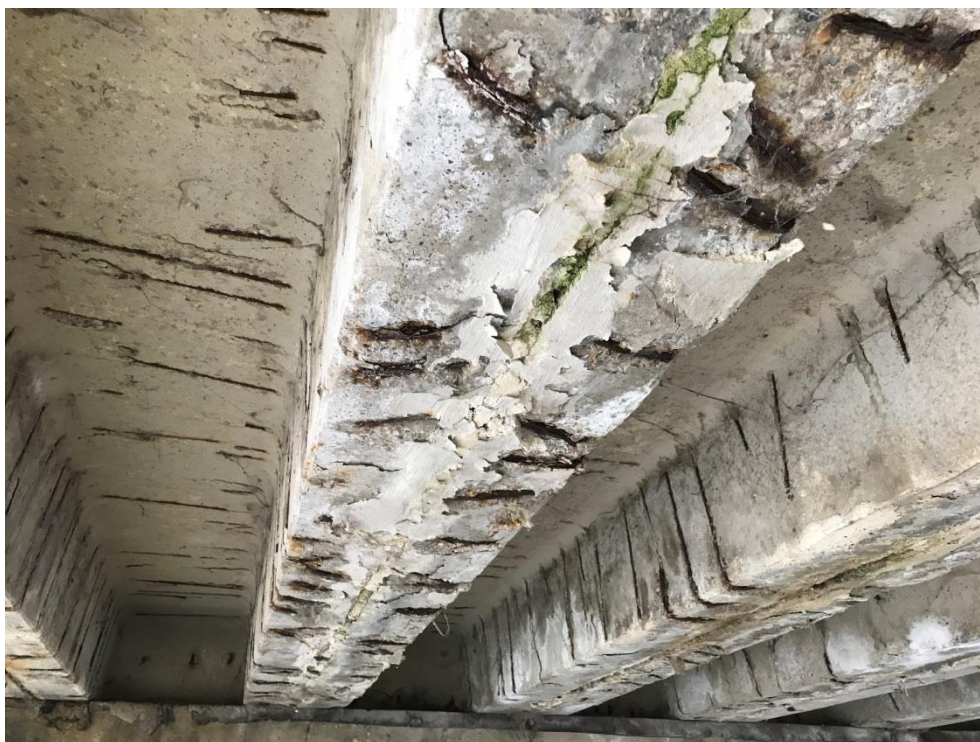
Obr.8 - Koroze výztuže prefabrikátů, degradace krycí vrstvy