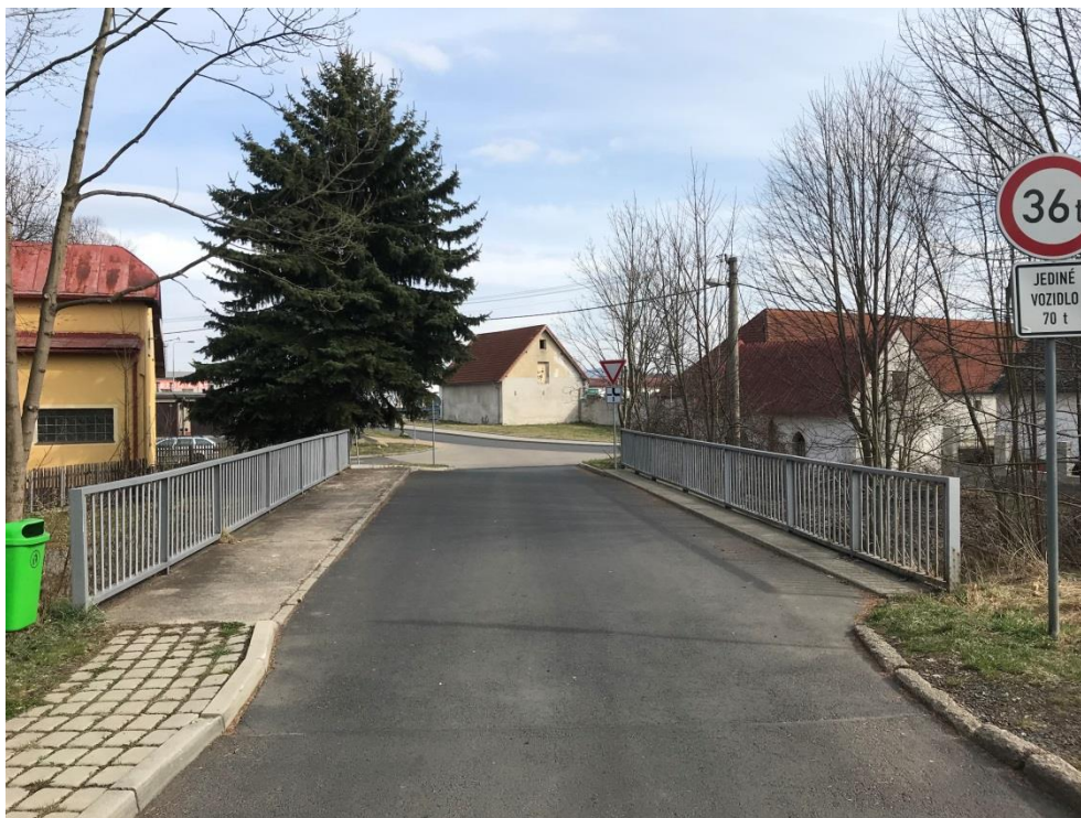
Obr.1 – Pohled v ose směrem k silnici Jáchymovská