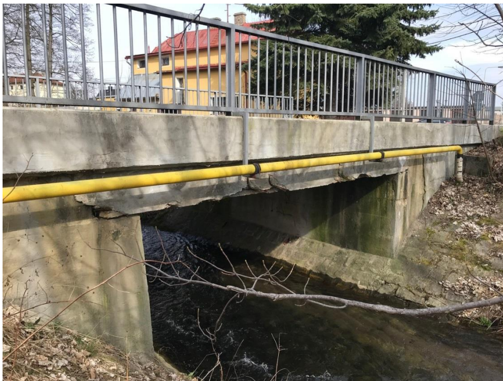
Obr.3 Povodní strana, STL plynovod