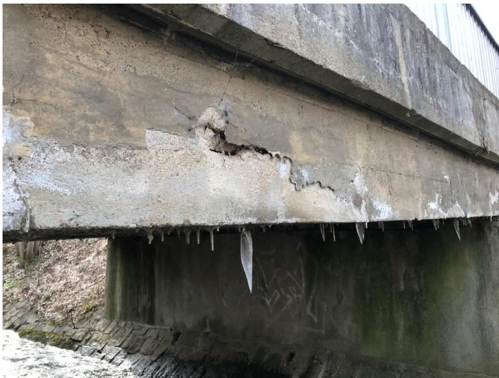
Obr.5 – Boční část nosné konstrukce na návodní straně